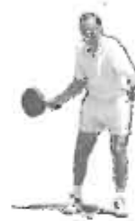
POSICIÓN DE PREPARADO

El jugador adelantará la pala con un movimiento semicircular hasta llegar al punto de impacto.